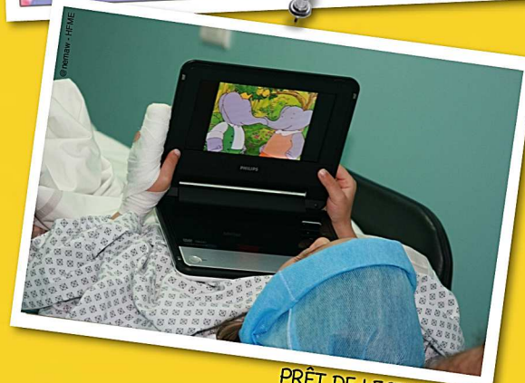
PRÊT DE LECTEURS DVD

Certains de nos projets ont été soutenus financièrement par la Fondation APICIL et MACSF mais aussi :