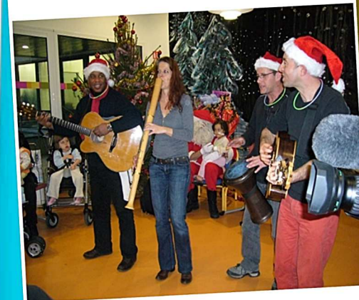
Fête de Noël